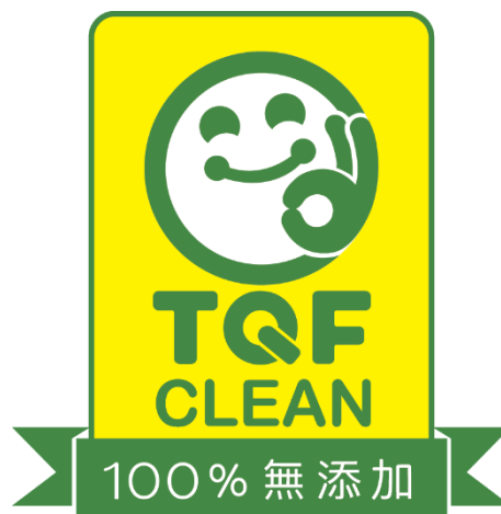
TQF Clean 100%無添加標章